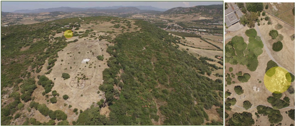
Figs. 1, 2 - El área de la necrópolis hipogeica (resaltada), (foto de Unicity S.p.A.)

La necrópolis fenicia forma el grupo de sepulturas más antiguas halladas hasta ahora en el Monte Sirai, que datan entre finales del siglo VIII y el siglo sucesivo.