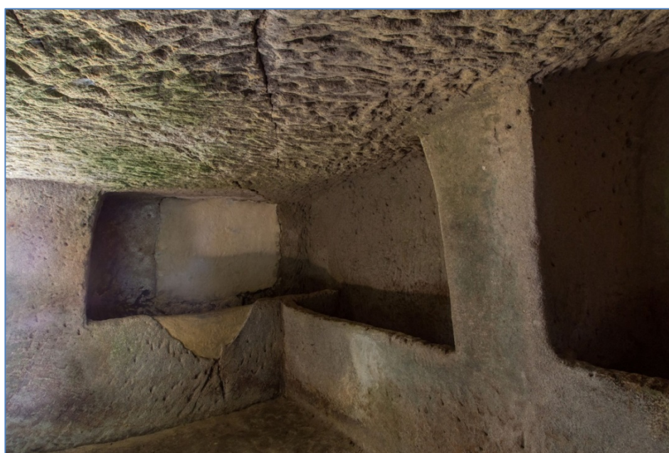
Fig. 4 - Sarcófagos de la tumba nº 5 excavados en la roca

Se distinguen por el uso de pilares y decoraciones de figuras y símbolos (como las máscaras en relieve de los techos, o una marca de la diosa Tanit, del revés, sobre un pilar de la tumba nº 5 (fig. 4). Caben destacar también los sarcófagos excavados en la roca (fig. 4), los nichos y, lamentablemente evanescentes, los restos de pintura roja.