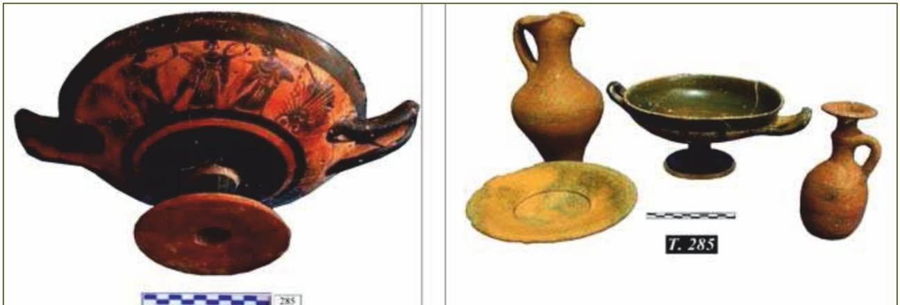
Fig. 3 - El ajuar de la tumba nº 266, con la cílica ática con figuras negras (de GUIRGUIS 2012, fig. 8).