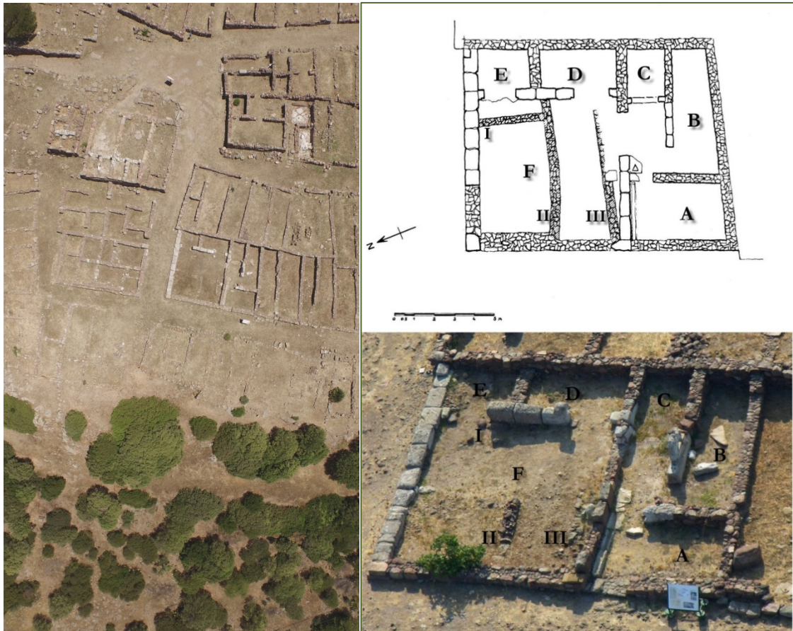
Figs. 3, 4 - La casa Fantar (foto de Unicity S.p.A.; GUIRGUIS 2013, fig. 19).

Se trata de una vivienda con patio, cinco espacios y un pasillo de acceso, que probablemente contó con dos niveles (figs. 3 y 4). Además, hay un pequeño ambiente cerca de la entrada que pudo haber sido un almacén o un taller-tienda.