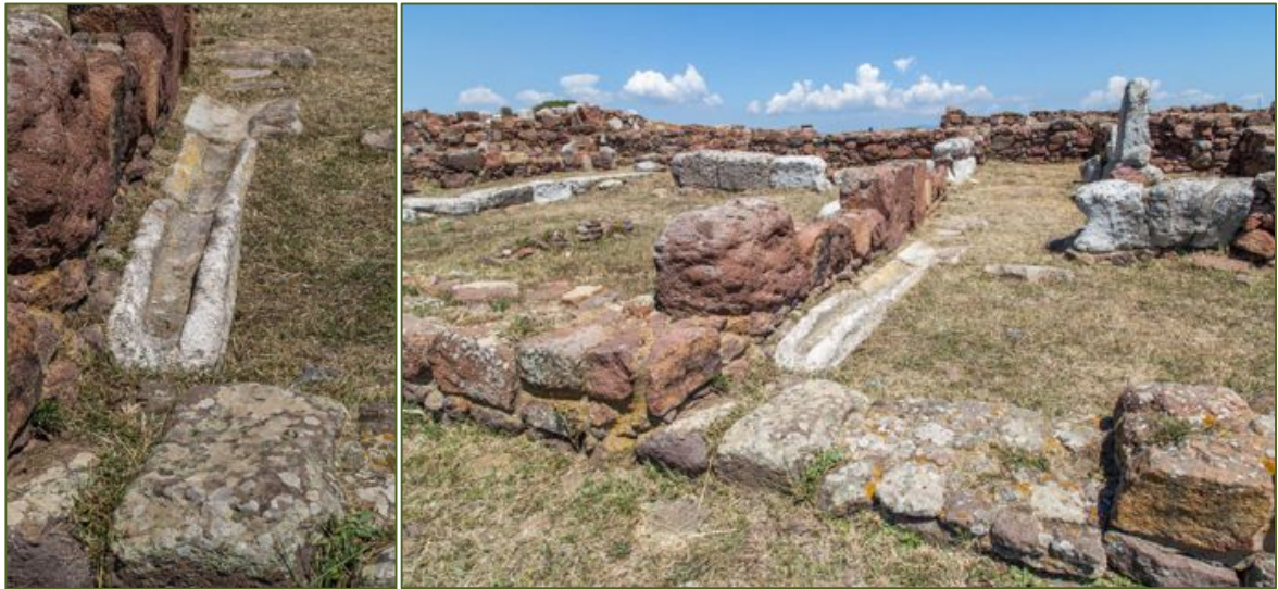
Figs. 5, 6 - Canaleta de caliza y su relación con la carretera.

Es significativo el uso de grandes bloques en opus quadratum como muros portantes (fig. 7).