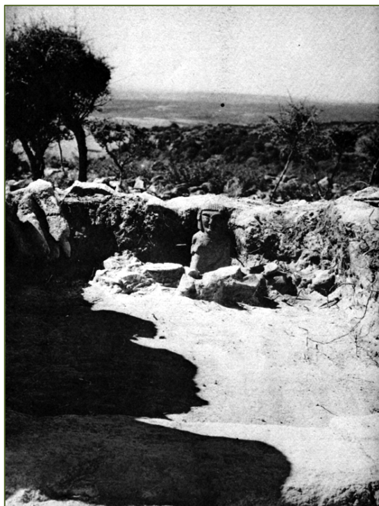
Fig. 5 - La estatua de Astarté encontrar en la parte inferior de la casa hasta el centro de la célula (foto CNR-Università degli Studi di Roma, da E. ACQUARO, Cartagine, un impero nel Mediterraneo , Roma 1978, fig. 34)

En 1966, Maria Giulia Amadasi, Mhamed y Dalila Fantar desvelaron varios edificios residenciales de la era púnica y romano-republicana 8 . En los años siguientes excavaron otros ambientes de la localidad.