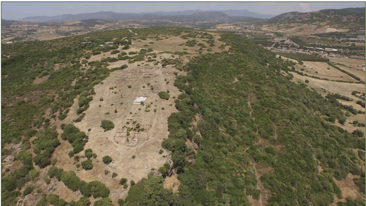
Fig. 1 - Monte Sirai

Desde hace bastante tiempo, el yacimiento de Monte Sirai llama la atención de expertos y geógrafos, ya que representa un lugar distintivo del paisaje y de la memoria de los lugares.