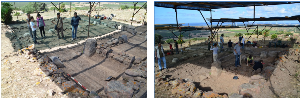
Figs. 6, 7 - Monte Sirai, junio-julio de 2015: excavaciones en la 'Casa la toba'.