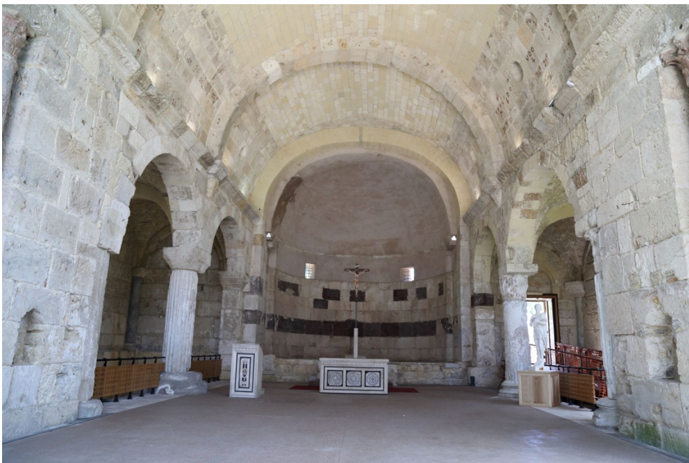
Fig. 1 - Inside the church, on the left wall there is the ashlar with the Kufic inscription.

In the inner wall of the left-hand side nave in the eastern transept of the basilica (fig. 1), consisting of a great deal of reused material, there is a walled ashlar made of local limestone, 1.50 m wide and 0.78 m high, where an inscription in Kufic script, irregularly arranged on four lines, is recognisable, although with a certain difficulty due to its poor state of repair (figs. 2-3). The text is still under investigation, but an initial proposal for dating the artefact is oriented towards between the first half of the ninth and the second half of the tenth century, on the basis of some comparisons within the European context, and by analogy with the funerary inscriptions found in the area outside the basilica. The two examples prove the local existence of Arabic speakers professing the Muslim religion, who perhaps shared their funerary spaces and the cult of San Saturnino.