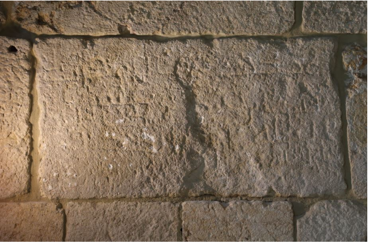
Fig. 2 - The ashlar with the etched Kufic inscription (photo by Unicity S.p.A.).