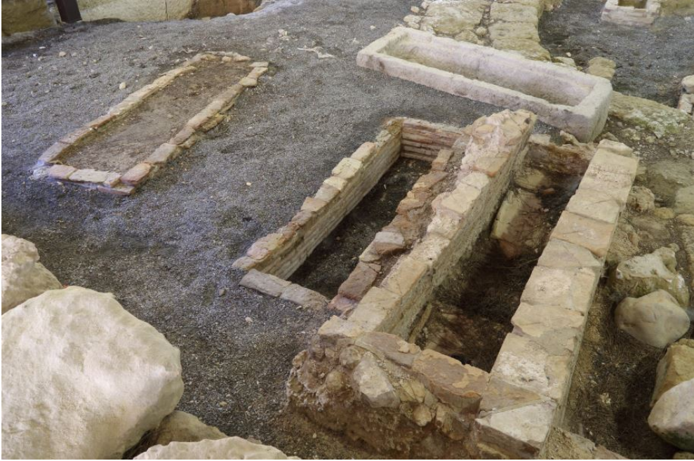
Fig. 2 - Pit tombs covered with stone slabs and bricks.