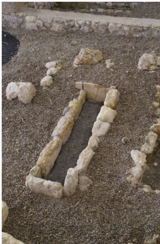
Fig. 1 - Pit tomb covered with stone slabs and bricks (photo by Unicity S.p.A.).

There are various types of burials in the funerary area next to the church. Among these, the simplest ones consist of pit tombs: they are formed by a rectangular hole dug into the ground, sometimes covered with stone slabs, or simple stones or bricks, bound with lime and rarely plastered (figs. 1-3); the body of the deceased was placed inside in a supine position. The covering is of simple soil or slabs of marble or stone, or of mosaic panels, which allowed identifying the deceased at floor level.