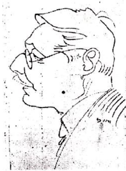
Fig. 2 - Caricature of A. Taramelli by T. Sini (from ZUCCA 1992).

During his career, he held several posts such as Inspector for the conservation of monuments (1895), Director of the museum and the antiquity digs of Cagliari (1908), Superintendent of the archaeological digs and museums of Sardinia (1924), Professor of Archaeology of the University of Cagliari.