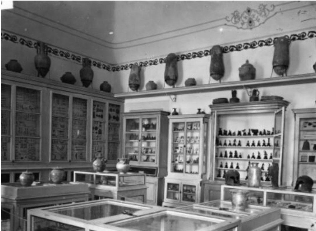
Fig. 4 - Exhibition hall of Palazzo Vivianet in Via Roma (from PALA 2014, p. 415, fig. 2).

In 1914 they acquired the Gouin collection which included several finds coming from Cornus, this plus the massive finds made during the explorations of Taramelli himself all over the island.