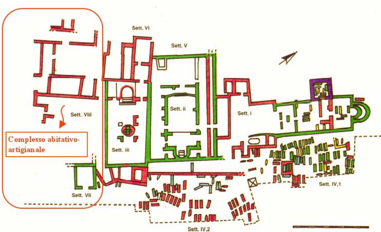
Fig. 1 - Columbaris basilica area with indication of the residential-crafts complex (drawing F. Collu, from Cornus I, 1, p. 200, tab. II).

To the south of the Columbaris religious chambers there are a number of spaces arranged around a central one, interpreted as probably being the bishop's residence annexed to the crafts district (fig. 1).