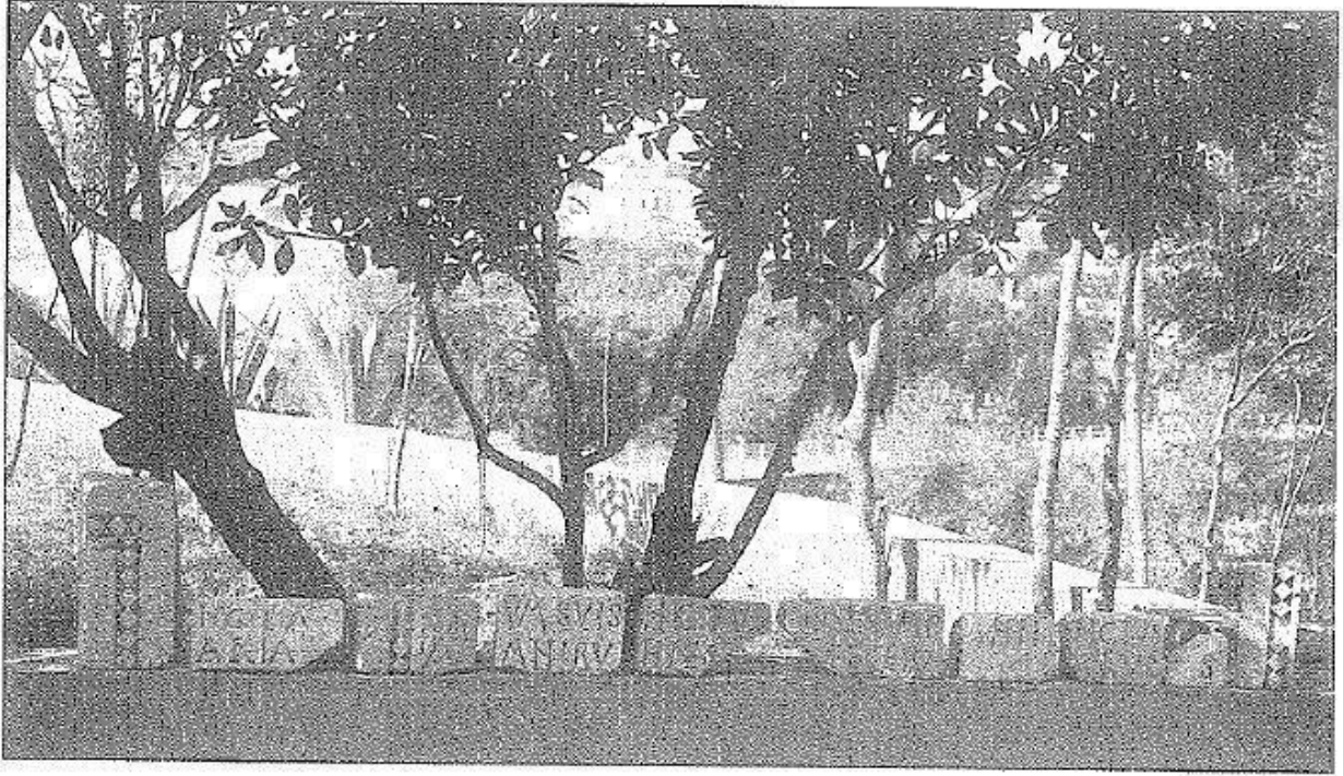
Fig. 5 - Fragments of architectural decoration (from Cornus 1.1, p. 45, fig. 28).

The non-conclusion of the items seems to indicate a sudden stoppage in the workshop activity - around the 7th century, based on the style comparisons - perhaps due to a traumatic event that involved the site causing it to be abandoned. This workshop was not the only business in the area: Finding waste metal and glass led to the assumption of a real crafts district, linked to the episcopal complex being rebuilt in the VI century. In those workshops, they probably produced liturgical items to be used in the churches; and everyday ones for the bishop and clergy who lived in the residential area.