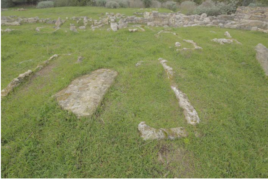
Fig. 5 - Cemetery area in its current state.