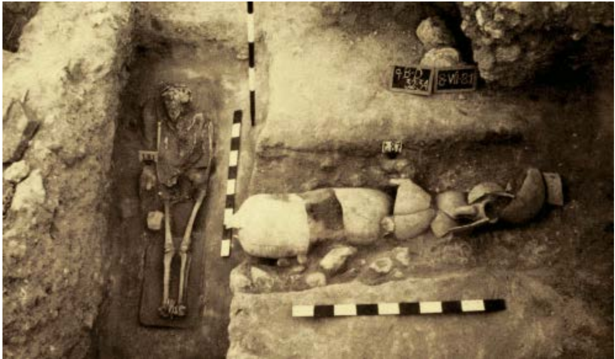
Fig. 1 - Eastern cemetery area, South sector, tomb 87, seen from the East (from GIUNTELLA 1990, p. 217, fig. 3).

The area of Columbaris was used from the first half of the 4th century as a burial area: the tombs dug into the rock were capuchin or enchytrismos tombs (fig. 1), some covered by rock, others by prismatic mounds or plastered slabs, sometimes painted red (fig. 2).