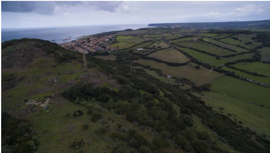
Fig. 2 - Campu 'e Corra: hill of Corchinas and surrounding territory.

The villas recognised in Campu 'e Corra (fig. 2) are the one in Sisiddu (fig. 3), Lenaghe and the hypothesised one in Columbaris, where the Christian complex rose.