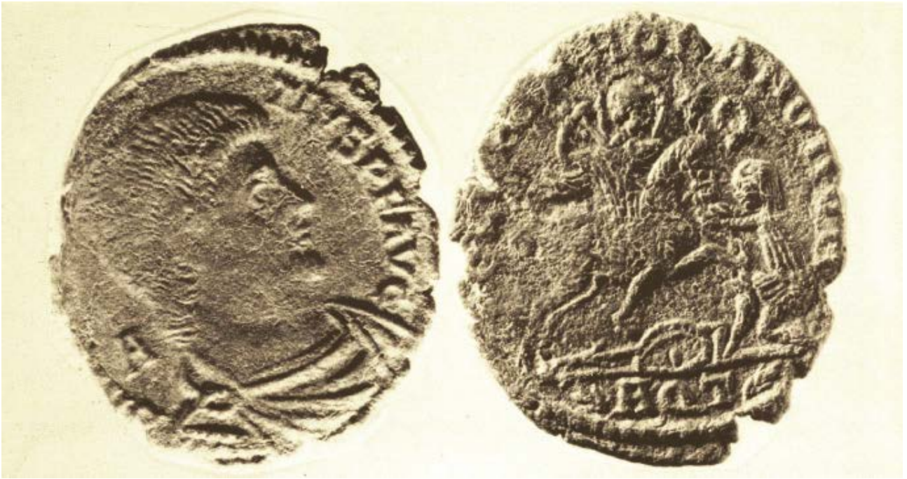
Fig. 4 - Columbaris - Sector III: aes of Magnentius, 350-352 A.D. (from CUGLIERI I, tab. XL).