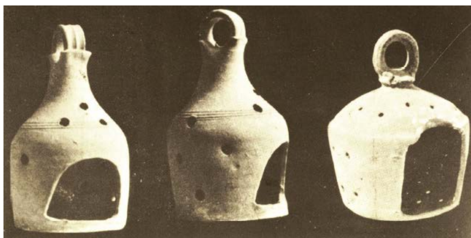
Fig. 4 - Palestinian lamp holder (from GIUNTELLA et al. 1985, p. 78, fig. 71).

The fragments can be compared with items from the east, with three lantern holders found in Palestine (fig. 4), in similar shapes found in the eastern Mediterranean basin, that can be dated between the end of the 5th and the beginning of the 6th century - and in Syria and Tunisia with two full examples, but out of context. In some cases, a ring was found on the top of the lantern holder, used to position it. In the peninsula, some fragments of the same type from the catacombs of S. Giovanni in Siracusa have been found.