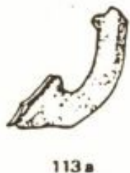
Fig. 2 - Columbaris, cemetery area: glass fragment corresponding to the Isings shape 134 (from ISINGS 1957, p. 162).

5th century A.D. This item would seem to be part of a terracotta item, dated in the period between the 4th and 6th century A.D.