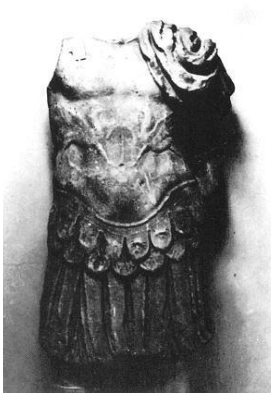
Fig. 3 - Cagliari, National Archaeological Museum: armoured bust (from SALETTI 1989, fig. 32).

In Imperial times, the armoured statue was mainly adopted to highlight military duties and merits to emphasise the warrior's charisma. Its public use was difficult in Rome however (the first loric statue was probably of Caesar in his Forum) and was only reserved for Emperors or their nominated heirs, with imperium (fig. 4). The prototype of the imperial armoured statues, used until the late Empire period, is Augustus of Prima Porta (fig. 5). In Sardinia, there have been numerous finds of this type coming from important Roman centres (Sant'Antioco - fig. 6, Porto Torres, etc).