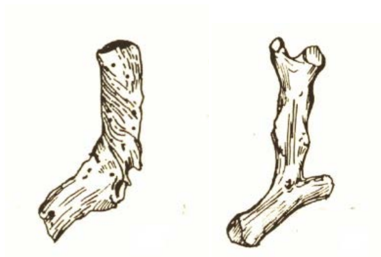
Fig. 2 - Drawing of the coral twigs found in the cemetery area of Columbaris (from CUGLIERI I, tab. XCV, nos. 28-29).