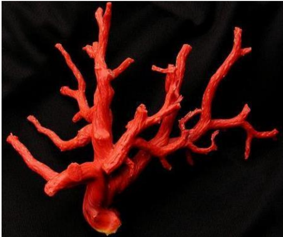
Fig. 5 - Coral branch.

The Greek and Latin sources sporadically mention coral (fig. 5) mainly in medical, nature and geographical works. These volumes show the difficulty in identifying this material, to the point where it is classified as being a part of the animal world, the mineral world and the plant world.