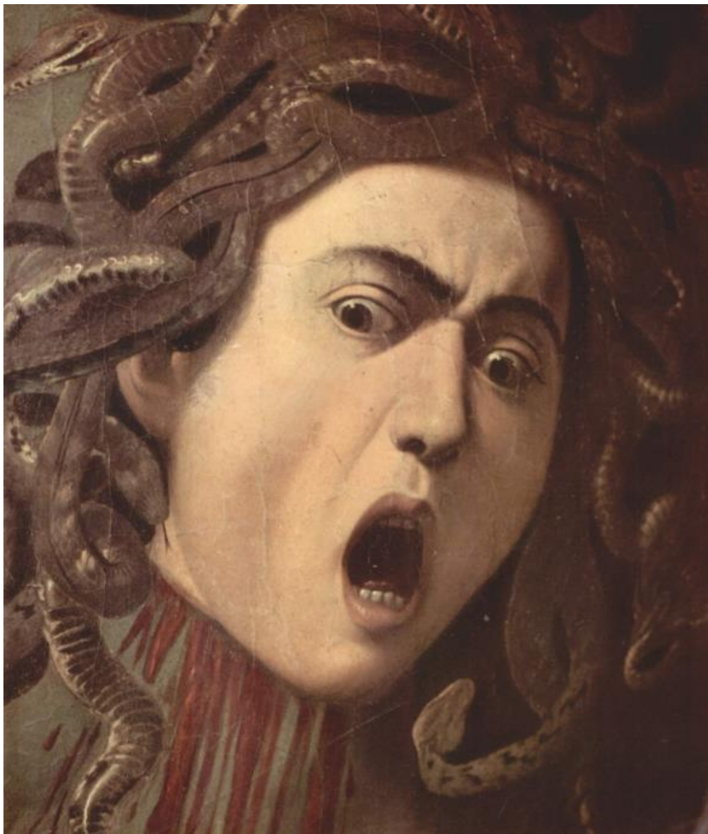
Fig. 4 - Florence, Gallery of the Uffizi: detail of the head of Medusa from "Shield with the head of Medusa" by Michelangelo Merisi called "Caravaggio" (1595-1596)

In Greek mythology, coral is placed in relation with the blood from the head of Medusa (fig. 4), which, cut off by Perseus, was laid on a bed of algae. Impregnated by the Gorgon's blood, the plant elements are supposed to have turned into coral. From here the ancient belief that it solidifies when touched by a human, but has a different consistency in water.