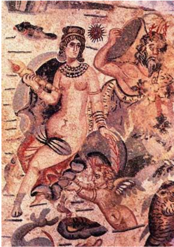
Fig. 6 - Piazza Armerina, Roman villa: the mosaic presents marine beings adorned with coral, IV-V century B.C..

For its magical powers, it was used as an amulet for both personal protection and for protection in special circumstances: during wars, navigation or working in the fields. In the Roman world it appears to be linked to a cultural aspect, connected to some gods. In late antiquity and the Middle Ages in Sardinia it was found in sites such as Sant'Imbenia (Alghero) and Sant'Eulalia (Cagliari) still in tomb contexts.