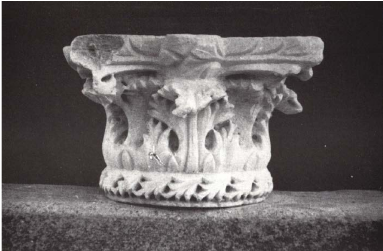
Fig. 2 - Columbaris: capital with finely serrated acanthus leaves (from SERRA 1992, p. 500, fig. 10).

re-used in the basilica of San Marco in Venice and two reused in the basilica of Santa Fosca in Torcello; further analogies are noticeable with items of Greek, Pontic and Iberian origin.