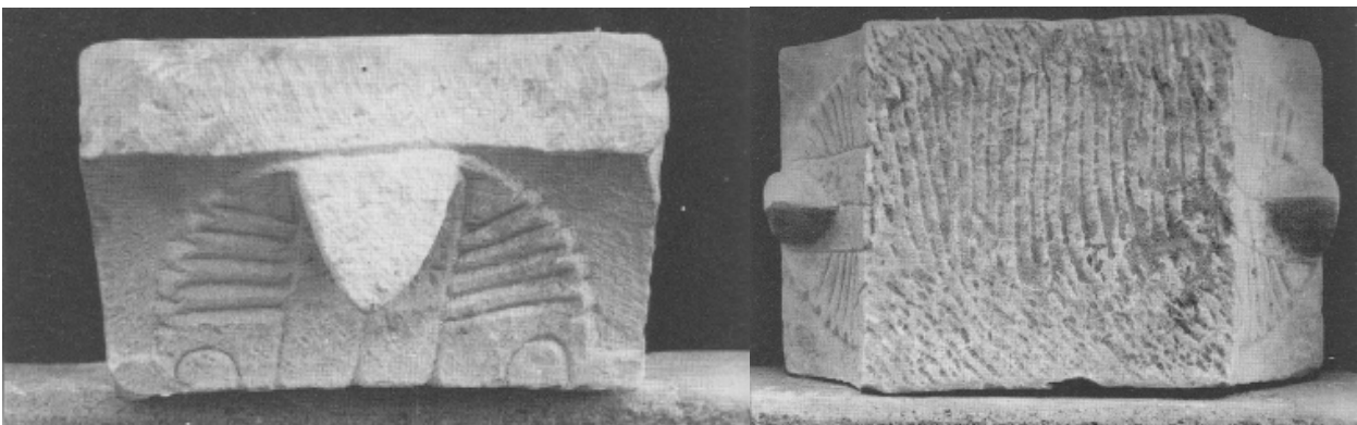
Fig. 4 - Capital-impôt with acanthus leaves (from CORONEO 2011, p. 268, figs. 470-472).

A considerable group of shelves and capital-impôts with bent top acanthus leaves were found; one of these in marble is datable between VI and VII century (fig. 4) To make the capitals, they often used reused materials like the shelf worked from the torso of a classic statue shows and the capital obtained from an Imperial Period architectural element (fig. 5).