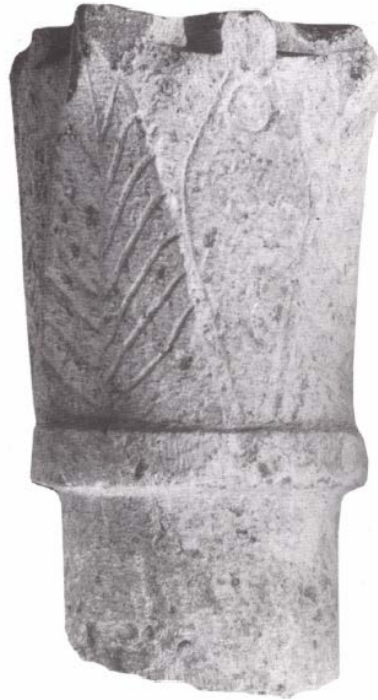
Fig. 3 - Columbaris: capital with fish and leaves (from SERRA 1995, p. 415, fig. 15).

A considerable group of shelves and capital-impôts with bent top acanthus leaves were found; one of these in marble is datable between VI and VII century (fig. 4) To make the capitals, they often used reused materials like the shelf worked from the torso of a classic statue shows and the capital obtained from an Imperial Period architectural element (fig. 5).