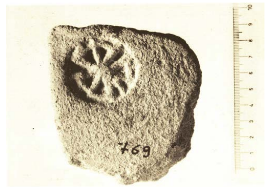
Fig. 6 - Basilica area of Columbaris: shelf with Patee cross amongst sculpture materials (From SERRA 1995, p. 411, fig. 4) and fragment of tile with a Greek cross bollus from the pastophorium in the greater baptistery (From DE MARIA 1986, tav CXI, n. 7; table CXV, fig. 3).

At least for the decorative fragments datable as of the VI century, the assumption is local production by a stonemason's crafts shop active in the crafts district, located in the southern sector of the Cornus complex (fig. 7). The items are currently kept partly in the G.A.