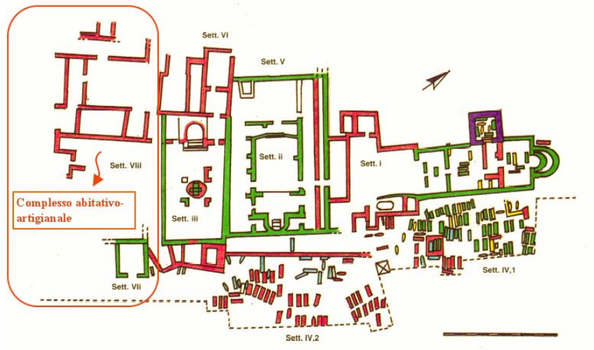
Fig. 7 - Columbaris basilica area with indication of the residential-crafts complex (Graphic reproduction F. Collu, by Cornus I.1, p. 200, table II).

Sanna National Archaeological Museum in Sassari, and partly at the municipal Antiquarium in Cuglieri.