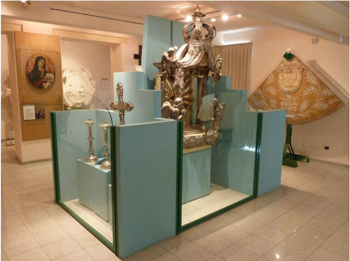
Fig. 2 - MUTSEU, exhibition area of the treasures from the churches of Sant'Eulalia, Santa Lucia and Santo Sepolcro (from http://it.cathopedia.org/wiki/File:Cagliari_MuTeS.Eulalia_salaespositiva.jpg ).

The building is on three floors: on the ground floor the Archives of the Parish and of the extinct Arciconfraternities of the Crucifix and the Holy Trinity and Precious Blood of Christ (XVII - first half XX century, fig. 3).