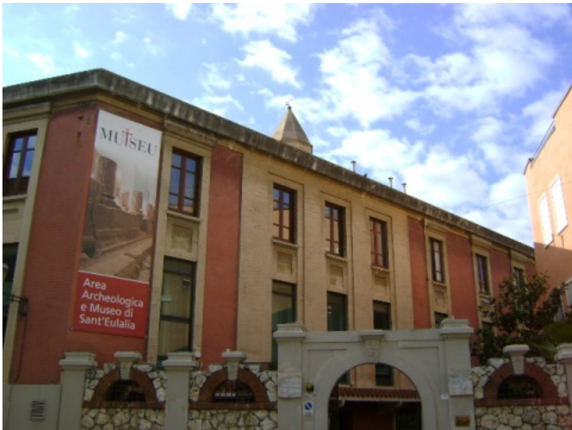
Fig. 1 - Entrance to the museum area of Sant'Eulalia-MUTSEU.

The MUTSEU (fig. 1), the Sant'Eulalia museum complex, is in vico del Collegio 2, in a building adjacent to the church of the same name, in the historical district of Marina in Cagliari: it includes the archaeological area, the exhibition of finds from the same site and the Treasure Museum (fig. 2) 1 .