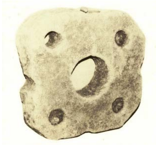
Fig. 2 - Villaputzu, location Longu Fluminu: holed stone (from Ledda 1989, p. 354, tab. XCVII, fig. 4).