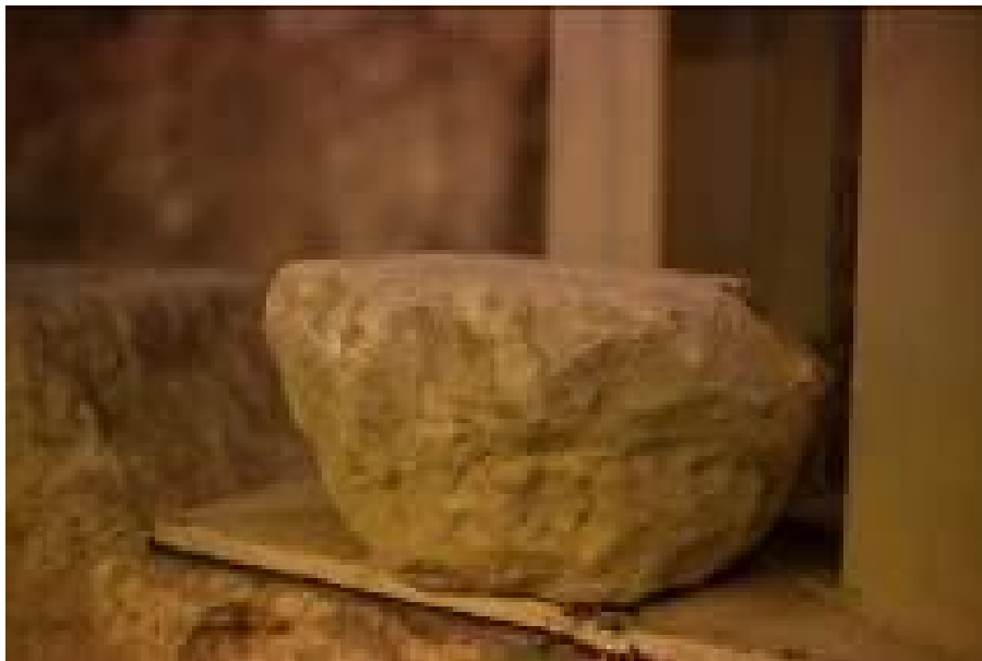
Fig. 3 - Drawing reconstructing the cistern and what it was used for (drawing by F. Nieddu).

This construction type finds its chronological acmé between the archaic/classical period and the Hellenistic period. Its closest comparisons can be found in the main Punic towns