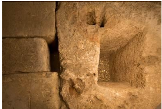
Fig. 2 - Rectangular pit saved in the podium.