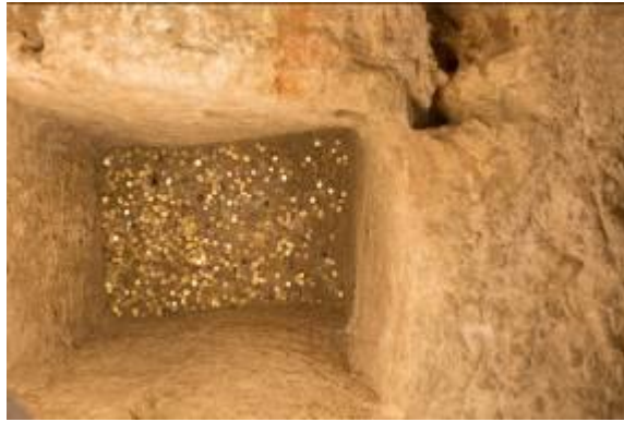
Fig. 3 - Thesaurus.

On the top of the base, there is a large square well (76x110 cm, 140 cm deep (fig. 4 B, D, E). Inside, full of earth and ash, the well has given up pottery and metal items, including 307 bronze coins from the Punic to Roman era 2 . Similar items were found in urban and non-urban sacred areas in central Italy from the late Republican period, between the second half of the 2nd century B.C. And the early Imperial Age 3 .