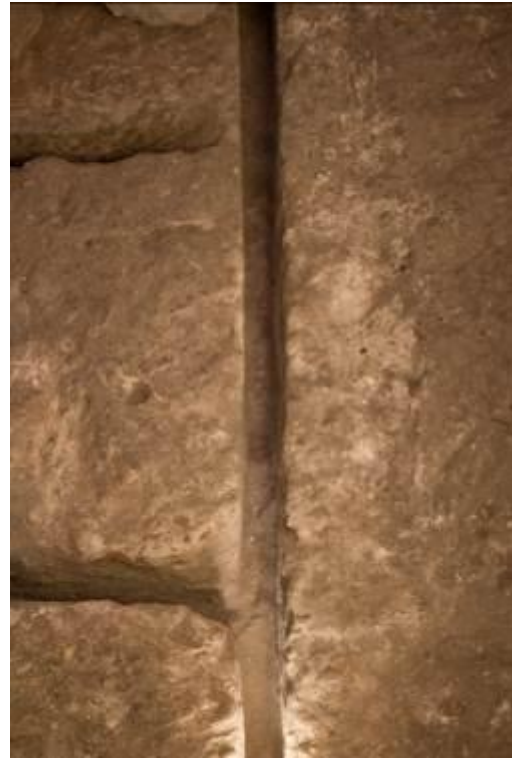
Fig. 4 - Detail of some blocks ready to be.

The stonecutter worked differently according to the depth of the extraction level: from above, kneeling down or standing up to a depth of 50-60 cm, with the use of long-handle pickaxes (fig. 5).