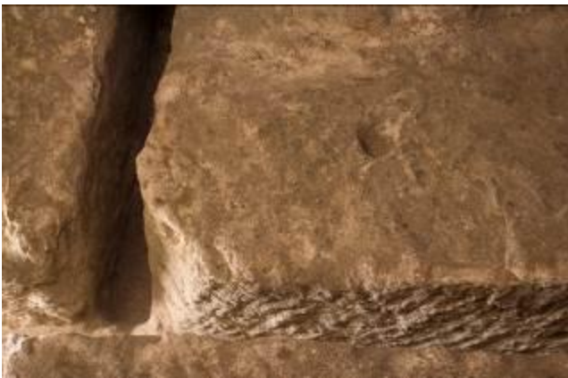
Fig. 3 - Detail of cutting between two limestone blocks extracted

The orthogonal cuts made to extract the blocks in an orderly manner can still be seen 1 . This technique, known as “hand cutting” was for the systematic cultivation of the quarry and consisted in separating the six sides of the parallelepiped with appropriate tools 2 . The quarry with large “terraces” had the prerogative of presenting the front side and the horizontal top that was already freed; later, making a border groove (figs. 3-4) the other three vertical sides were released 3 .