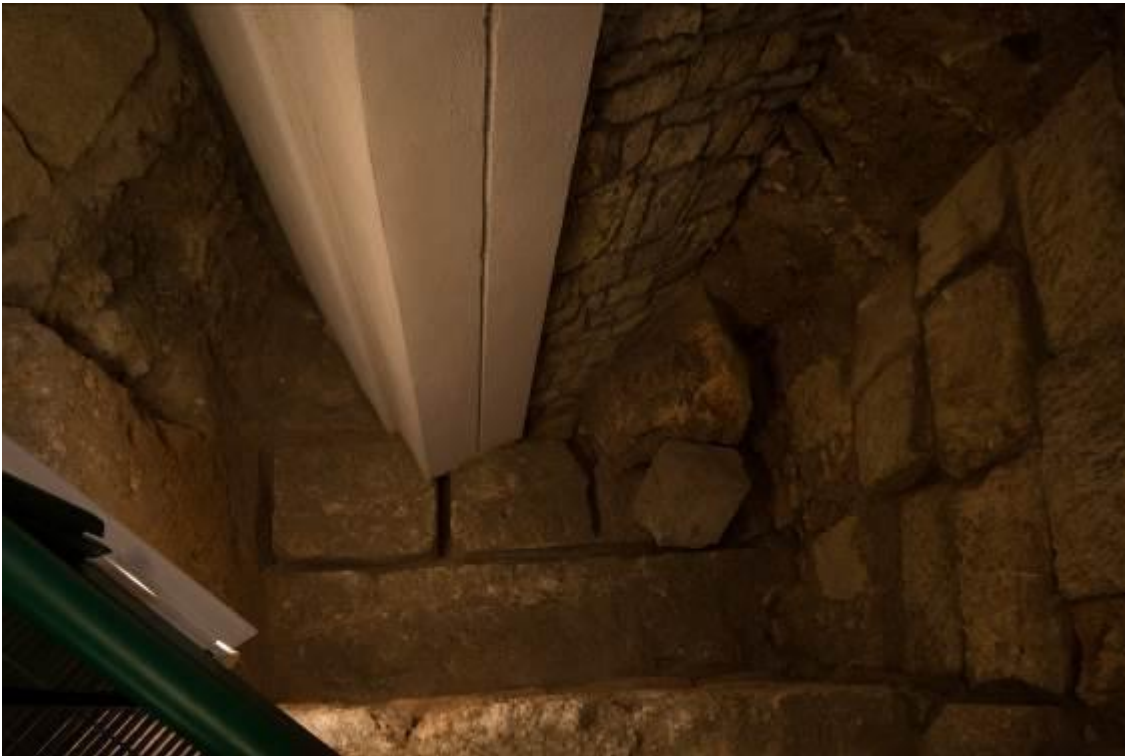
Fig. 1 - Orthogonal cuts to extract blocks.

The Sant'Eulalia area already had an open-air quarry in the late Punic period (IV-III sec. B. C.), (figs. 1-2A, 3-4).