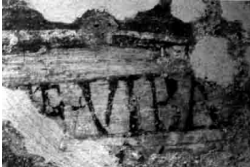
Fig. 4 - Sant'Antioco: detail of the painted inscription E VIBA in the arcosolium C/VII (from Nieddu 2011, p. 82, fig. 5).