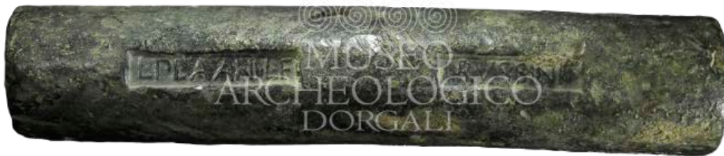
Fig. 3 - Lead ingot recovered in the waters off Cala Cartoe-Dorgali-dating to the II-I centuries BC.

One of the places to refer to in order to define the history of the territory's landscape and geography is that of the Roman station of Viniolai in the Dorgali countryside (place of Finiodda, the Oddoene Valley), named in the Itinerario Antoniniano , and located along the iter a Portu Tibulas Karalis . The most well known settlements sprung up near this route, that developed along the eastern coast of Sardinia. Other sites have been recognised at the two diverticula , i.e. intersecting branches directed inland, in the direction of the valley of Isalle and Oliena, towards inner Barbagia.