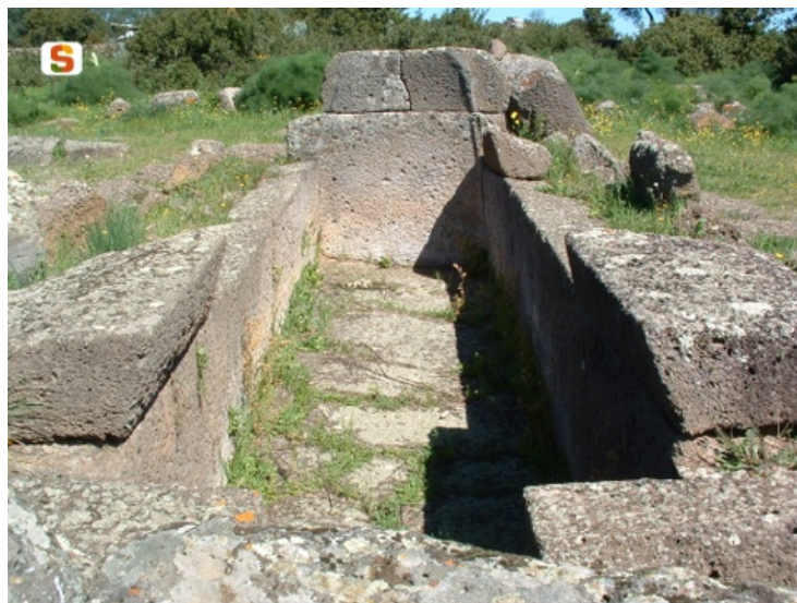
Fig. 5 - The burial chamber of giants' tomb 2 of Iloi in the territory of Sedilo.