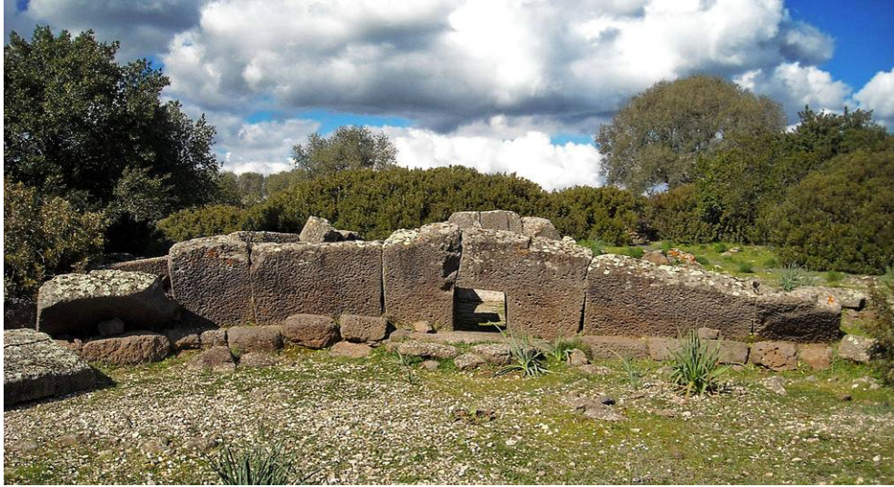
Fig. 6 - Giants' tomb 2 of Iloi in the territory of Sedilo.