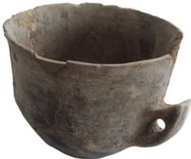
Fig. 6 - Carenated cup with axe-shaped handle on display at the Archaeological Museum of Vid-dalba.