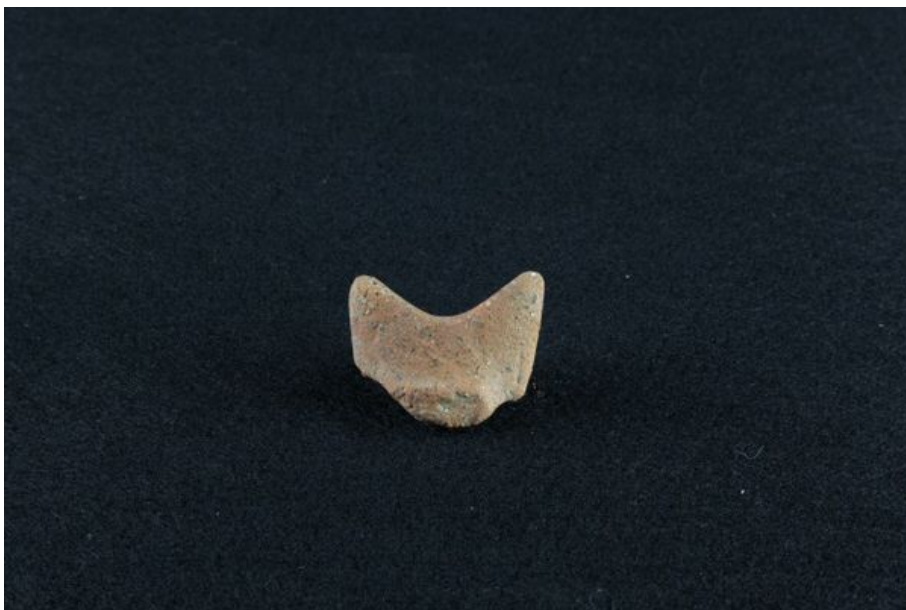
Figs. 1, 2 - Fragments of a raised handle with horns from Thomes.