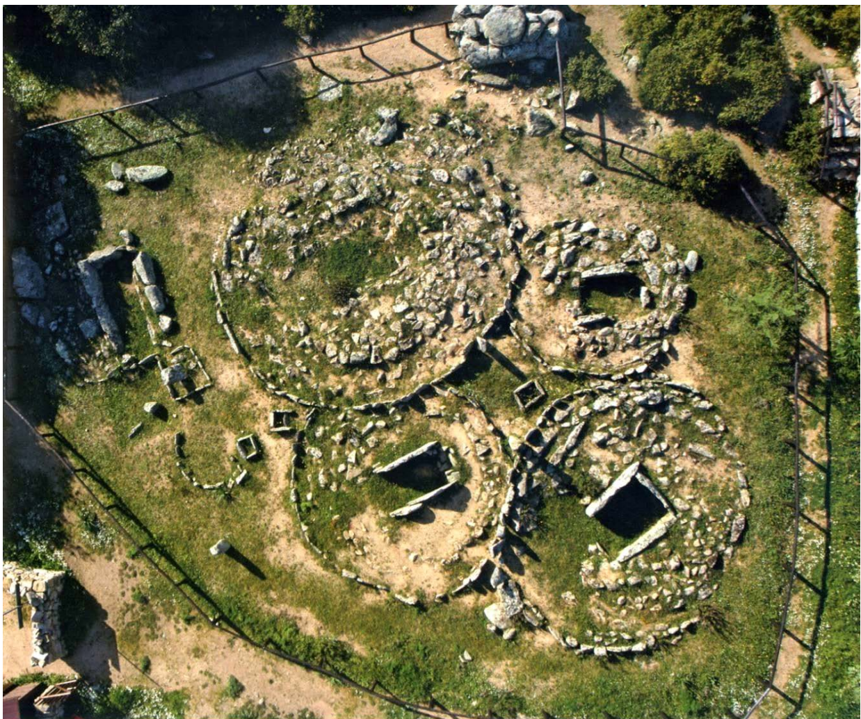
Fig. 1 - The site of Li Muri (from moravetti, alvito 2010, p. 21, fig. 6).

The lithic boxes (dimensions 0.40 x 0.50 m.) located in the space formed by the tangency of the circles, have been linked to the cult of the dead, whose devotion was manifested by depositing periodic perishable offerings, of which no trace has been preserved since the boxes were found completely empty (fig. 1).