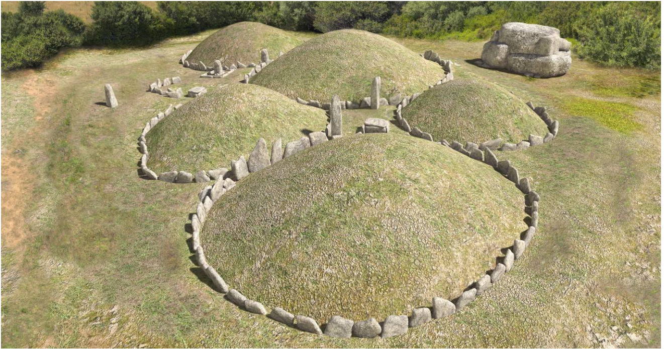
Fig. 3 - Rendering of the funerary circles.

Inside the tomb circle no. 2 sporadic elements of a green soapstone necklace have been found, whose material, according to scholars, was probably imported from Crete.