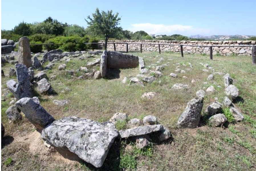
Fig. 2 - Arzachena, Necropolis of Li Muri, circle 1.