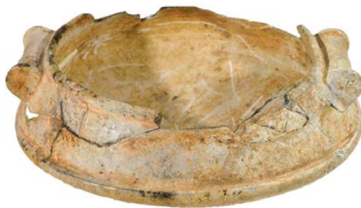
Fig. 5 - Arzachena, Necropolis of Li Muri, soapstone vase (from Antona 2013, p. 82).

The carenated soapstone cup with spool-shape handle (third millennium B.C.), preserved today at the National Archaeological Museum of Cagliari, comes from the funerary circle no. 1 as part of the deceased's funerary goods consisting of lithic hatchets, an apple-shaped spheroid in greenish soapstone, a slicker in hard red stone, siliceous knives, a bone awl and several soapstone necklace beads (fig. 5)