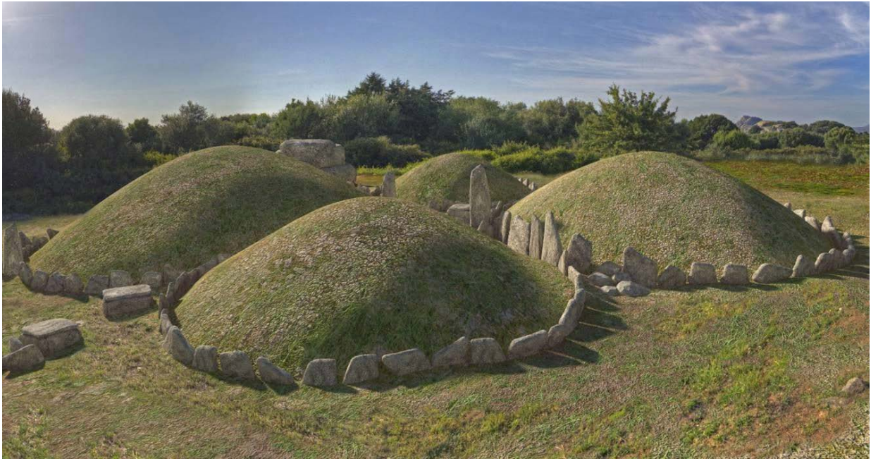
Fig. 4 - Rendering of funerary circles.

The carenated soapstone cup with spool-shape handle (third millennium B.C.), preserved today at the National Archaeological Museum of Cagliari, comes from the funerary circle no. 1 as part of the deceased's funerary goods consisting of lithic hatchets, an apple-shaped spheroid in greenish soapstone, a slicker in hard red stone, siliceous knives, a bone awl and several soapstone necklace beads (fig. 5)