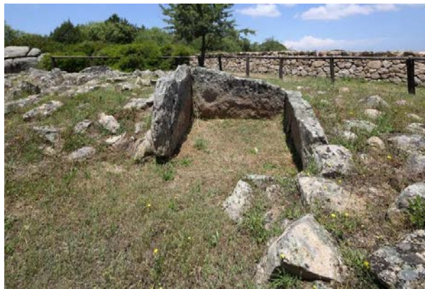
Fig. 3 - Arzachena, Necropolis of Li Muri, lithic cista of circle 1 (photo by Unicity S.p.A.).

Only the stones of the double external walls and the cista contained therein still remain of the entire circle. The small sized rubble it contains is all that remains today of the original mound (fig. 4).