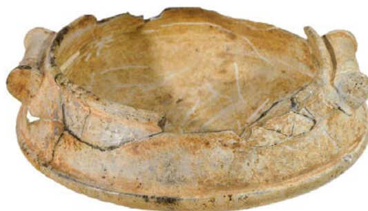
Fig. 2 - Arzachena, Necropolis of Li Muri, soapstone vase (from ANTONA 2013).

Finely crafted, it is mentioned among the most important materials unearthed by the excavation (fig. 2).