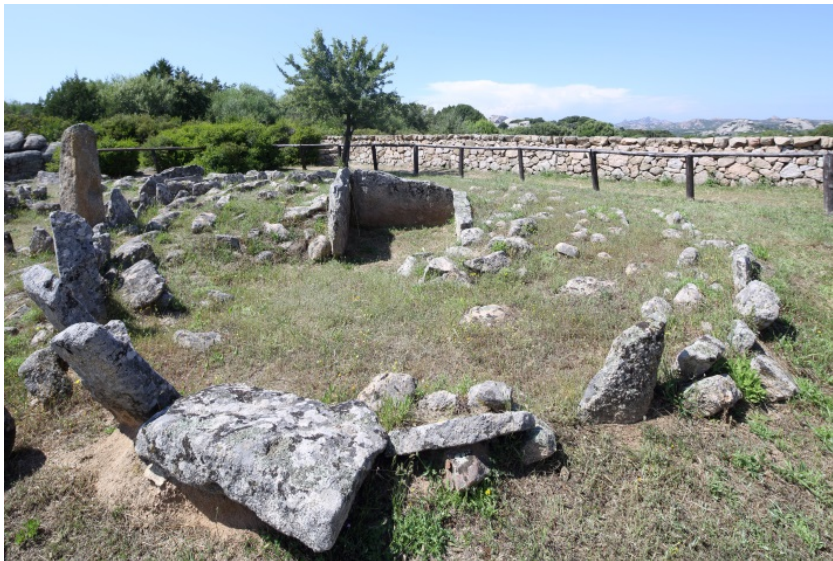
Fig. 1 - Arzachena, Necropolis of Li Muri, circle 1.

The soapstone cup was found in the stone cista of circle tomb no. 1 of the necropolis of Li Muri, and together with other items belonged to the funeral goods of the deceased (fig. 1). Its open-type shape could be attributed to the libations related to the funerary ritual.