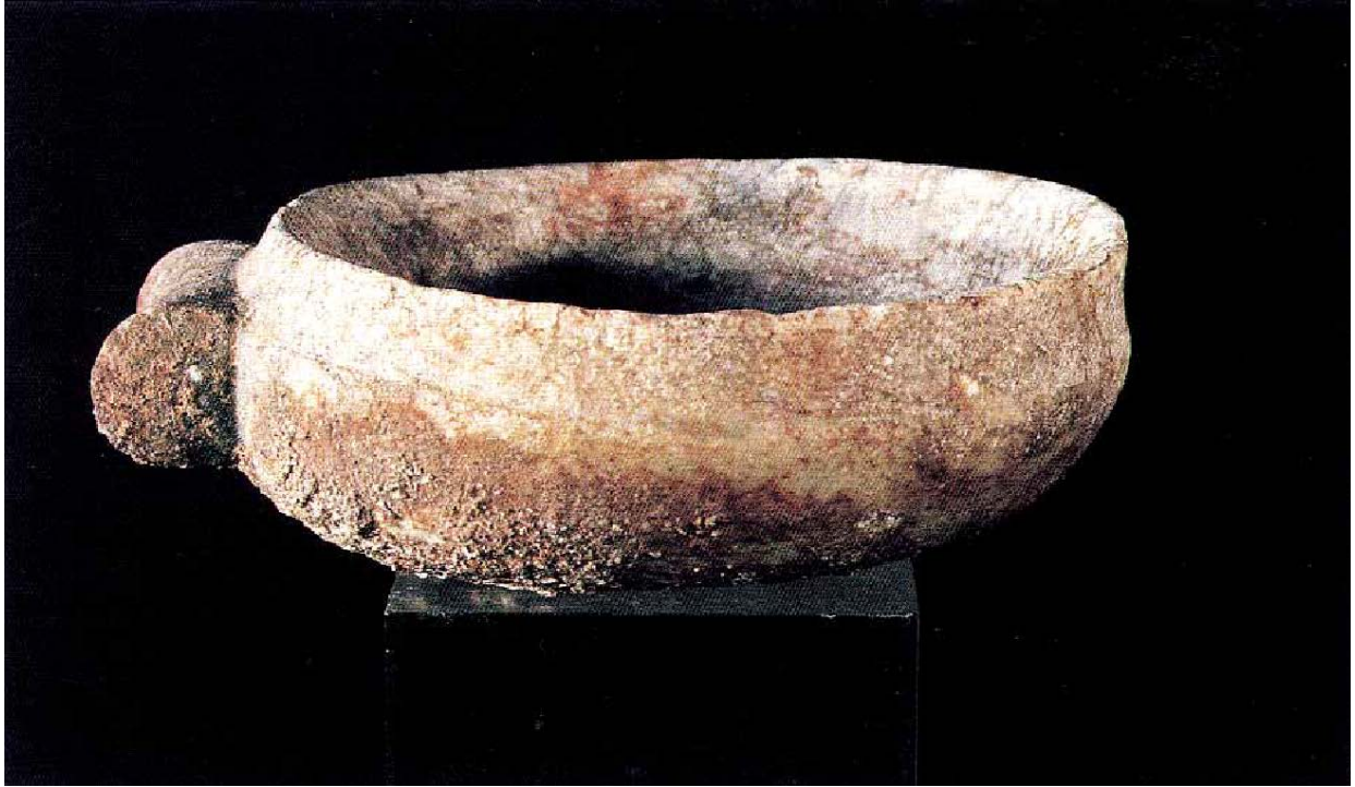
Fig. 5 - Calcite vase from Dolianova, Bingia Eccia (from LILLIU 1999, fig. 99, p. 84).

The small soapstone cup found in the necropolis of Li Muri is currently kept at the National Archaeological Museum of Cagliari.