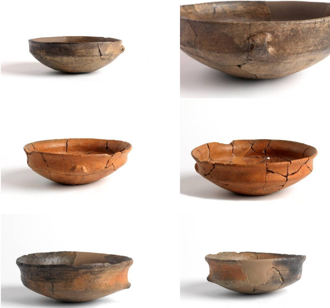
Figs. 1, 2, 3 - Bowls found during the digs of the village of Su Nuraxi.

Several bowls were found at the Nuragic site Su Nuraxi. They are made from pottery for use at the table, with a wide open shape, with straight or round-hold handles, used to prepare, carry and eat solid or liquid foods (figs. 1, 2, 3).