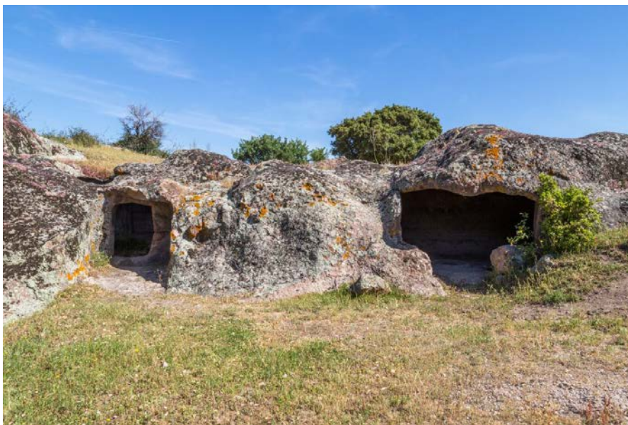
Figs. 1, 2 - On the right, the entrance to the domus de janas XI.