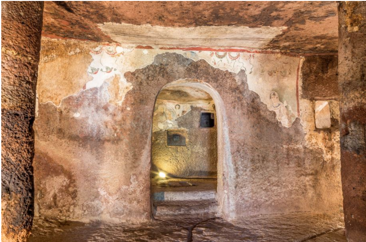
Fig. 2 - The door that leads from the room to the bimah.

In the inner cell (room), in the wall that contains the entrance to the innermost chamber (fig. 2), there are still some Christian frescoes, now ruined, that have been dated by experts back to the 4th-6th centuries A.D.: at the top, in a space surrounded by a red strip, there are painted garlands and birds (fig. 3), while to the left there is a female figure (fig. 4) observing the spectator and at the same time turning to the cross painted on the entrance of the same inner chamber.