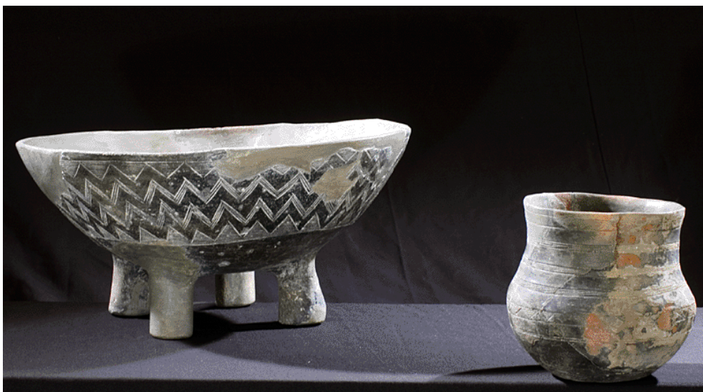
Fig. 3 - Bell-beaker bowl and beaker on show at the Sanna Museum in Sassari

The Eneolithic cultural facies of the Bell-beaker vase was widespread in Sardinia, in almost all funeral contexts, together with or overlapping the Eneolithic culture of Monte Claro and under the levels of the Ancient Bronze age of the Bonnannaro culture (figs. 3, 4).