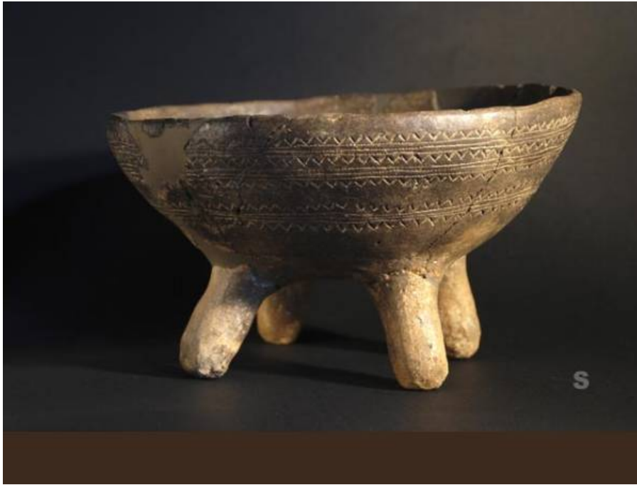
Fig. 4 - Bell-beaker tetrapod vase on shown at the Antiquarium Arborese in Oristano found in the megalithic tomb at Bingia'e Monti di Gonnostramatza.