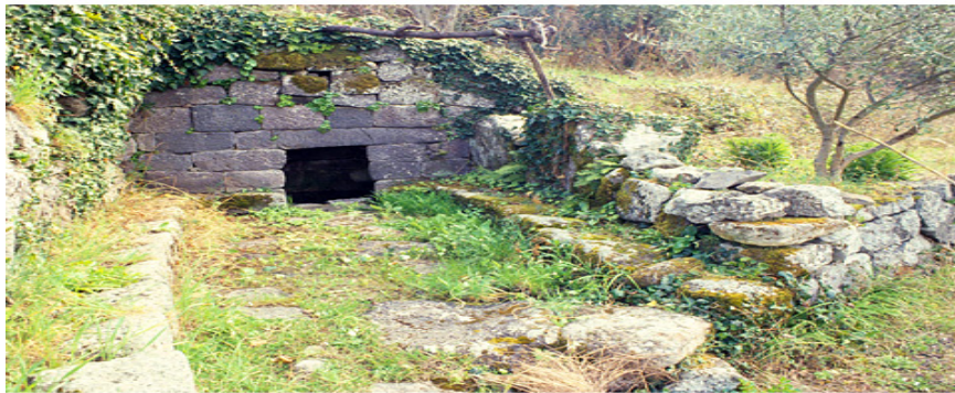
Fig. 1 - Su Lumarzu nuragic spring.

A votive miniature vase with four handles was found at Fontana Lumarzu, in Rebeccu a Bonorva (fig. 1), uncovered at the beginning of the 20th century and dated between the Late Bronze Age and the Early Iron Age, (fig. 2).