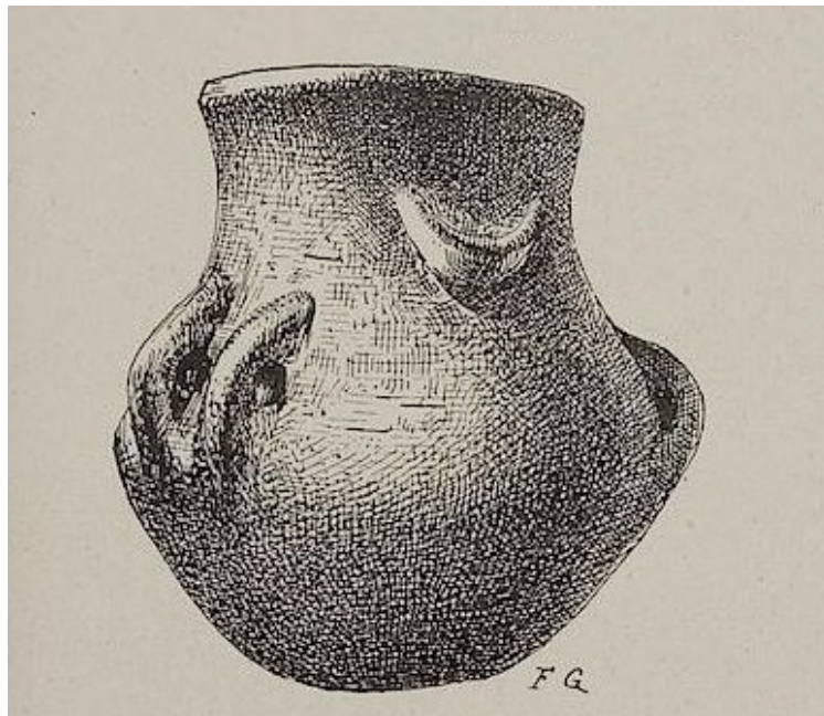
Fig. 2 - Miniature vase found in Su Lumarzu (from Taramelli 1919, fig. 21, page 57).