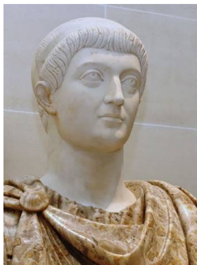
Fig. 4 - Bust of the Emperor Constans