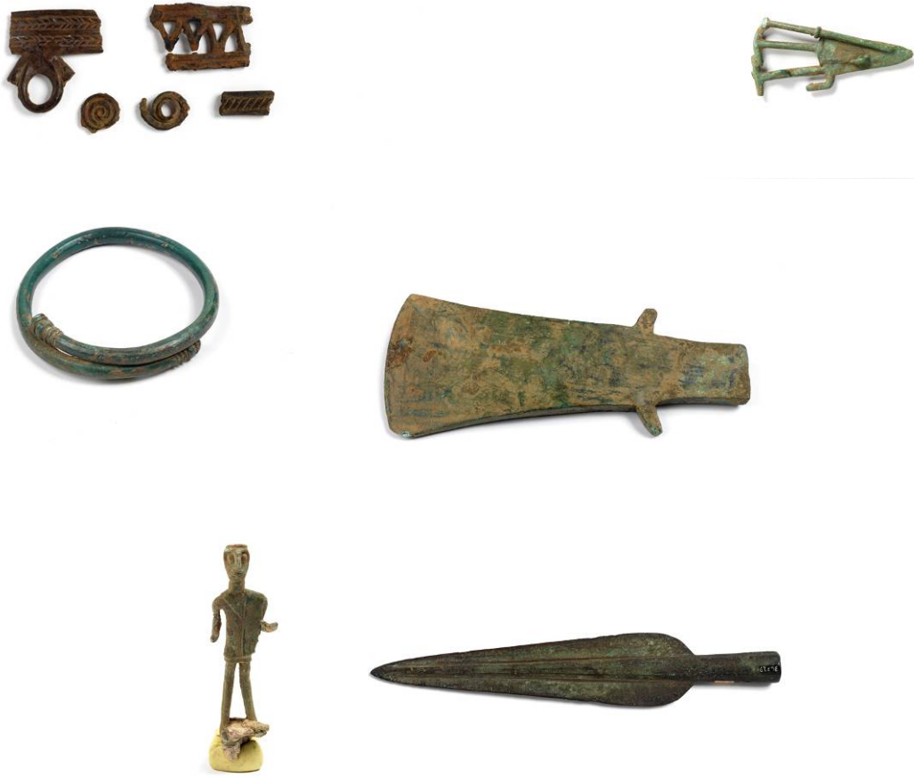
Figs. 2, 3, 4, 5, 6, 7, 8 - Bronze objects found.