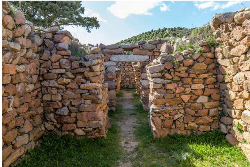
Fig. 2 - Interior of the megaron 1 temple. Room D in the background.

Part of the original stone flooring can still be seen. The wall at the back has a small sub-trapezoid shape niche, that is perfectly in line with all the corridors of the temple rooms (fig. 3).