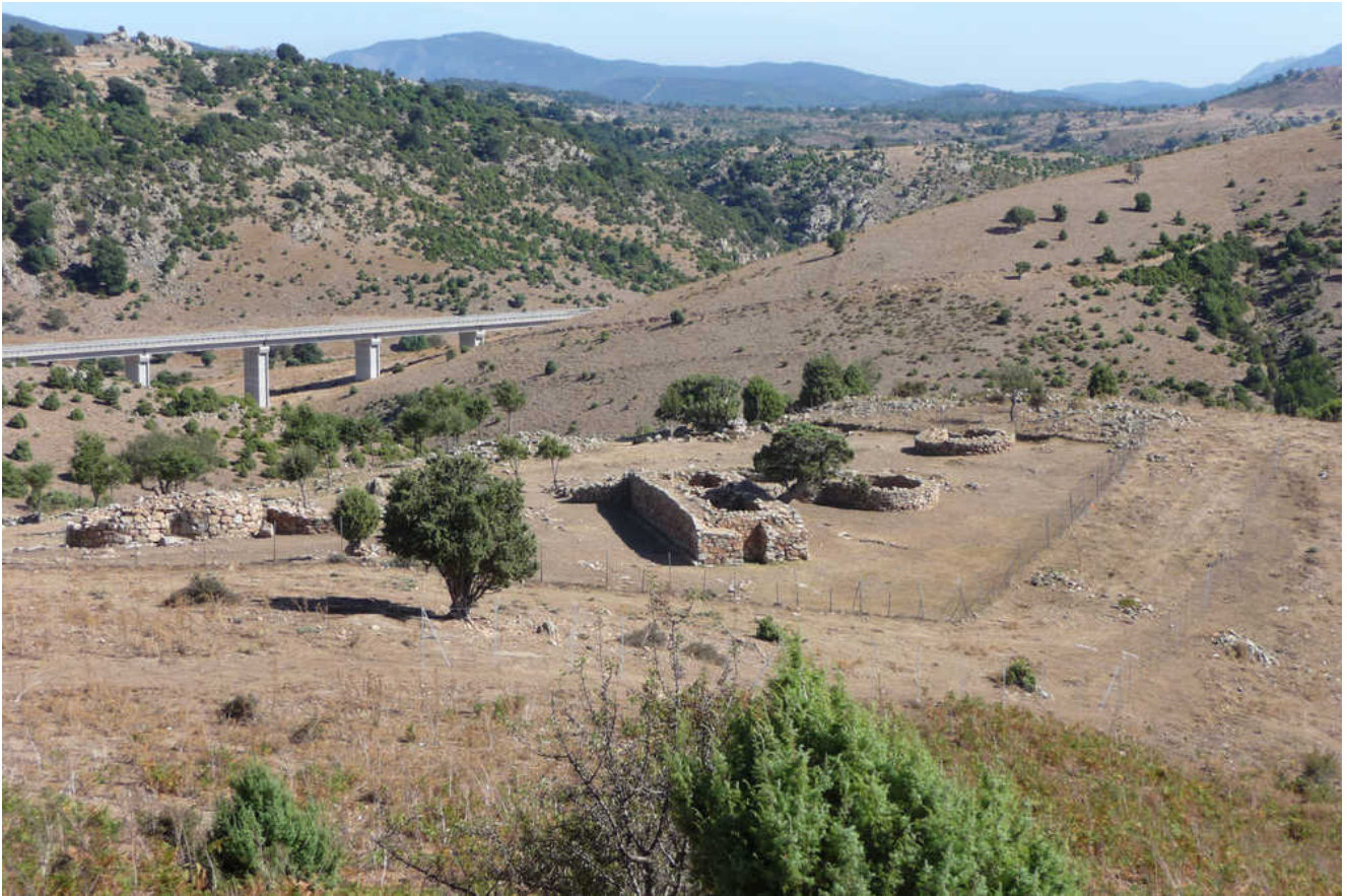
Fig. 3 - Overview of the site (from http://www.beniculturali.it/mibac/export/MiBAC/sito-MiBAC/MenuUtility/Immagine/index.html_647931255.html ).

The digs on the first megaron temple, during the 1980s and 90s, some of which were aimed at contrasting the plundering by unknown illegal diggers, emphasised the importance of the site and also the type, size and consistency of the temple, and the different phases of use and presumable relations with the adjacent built-up area, have proven that it was built on a previous settlement site, based on the context of materials used. In the years 2007-2011, other digs carried out brought to light another two temples, of which megaron 2, had a particular altar built inside the rear apse room, with square volcanic rocks and the façade decorated with two ram protomes in relief work, with a ritual fireplace made from basalt rocks imitating the top of a Nuragic tower.