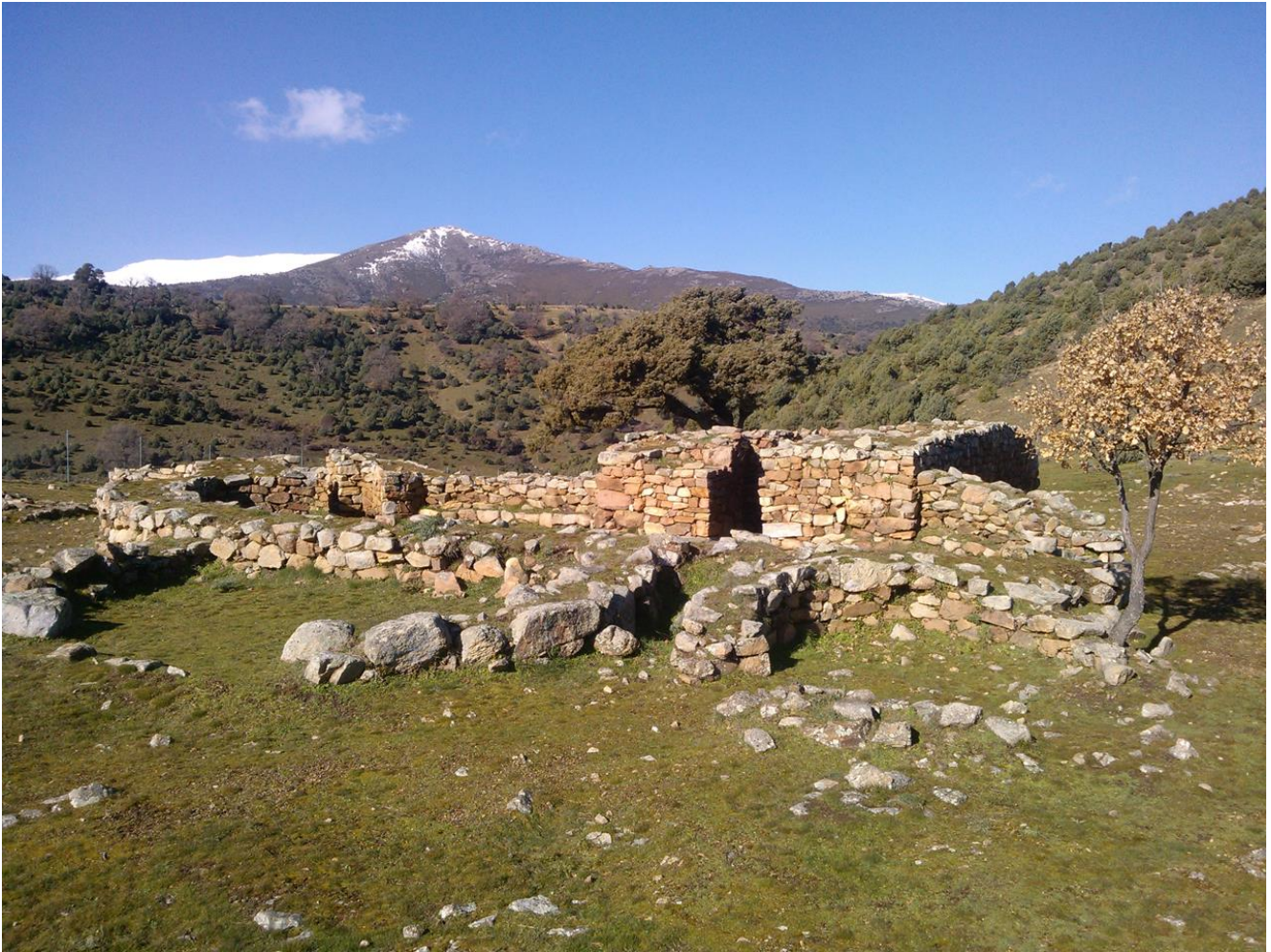
Fig. 4 - Overview of the site.