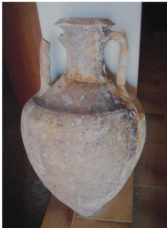
Fig. 1 - Greek-Italic amphora, from Arbatax (from SALVI ET ALII 2005, p. 73).

Produced in several centres of Magna Greece and Sicily, Greek-Italic amphorae were used to transport wine, but also olives and grapes.