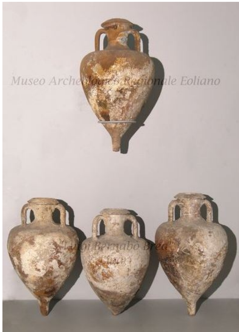
Fig. 4 - Greek-Italic amphorae exhibited in the Museum of Lipari.