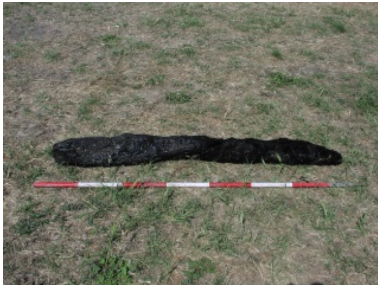
Fig. 1 - Fragments of carbonised wood.

The monastery of San Nicola di Trullas was abandoned due to a serious fire which occurred halfway through the 14th century. The risk of fires was rather frequent for middle age monasteries, as the only way to light the rooms was the use of candles and most of the furnishings were made from wood and fabrics, easily inflammable. The fire did not just consume the monastery from the inside, but also irreparably damaged the walls, making the roof collapse. Archaeologists have identified traces of combustion on many objects and antique architectural elements, recovered during digs, and which survived to date almost as an “instant photograph” of the dramatic episode (figs. 1-4).