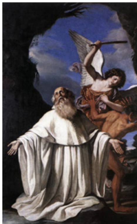
Fig. 5 - Guercino, San Romualdo, 1640-41.