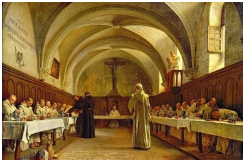
Fig. 3 - Théophile Gide, Le Réfectoire de la Grande Chartreuse , Nîmes, Musée des Beaux-Arts. ( http://3.bp.blogspot.com/-5wB_JCC8P1o/UIbw7nRRCPI/AAAAAAAAADuQ/XPjZivygb-U/s1600/theophile-gide-the-refectory.jpg ).

Camaldolese monks still try to dedicate some time in their daily life to what helps the basics of life, including prayer, rest and free time.