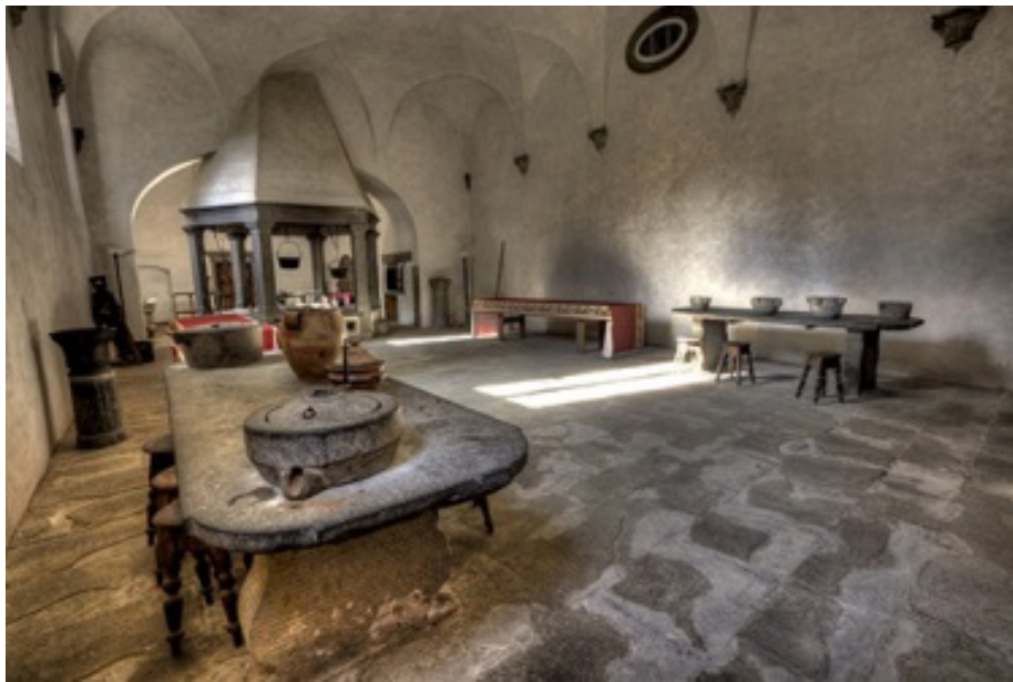
Fig. 1 - Kitchen of Vallombrosa ( https://www.flickr.com/photos/pinomoscato/sets/72157626426353731/detail/ ).

The Camaldolese monks followed Benedictine rules and were therefore extremely organised, for the importance given to canonic prayer, the obligation for the monk to live in the monastery, and for the acknowledgement of both manual work (agricultural) and intellectual work (study, transcribing of codes; figs. 1-5).