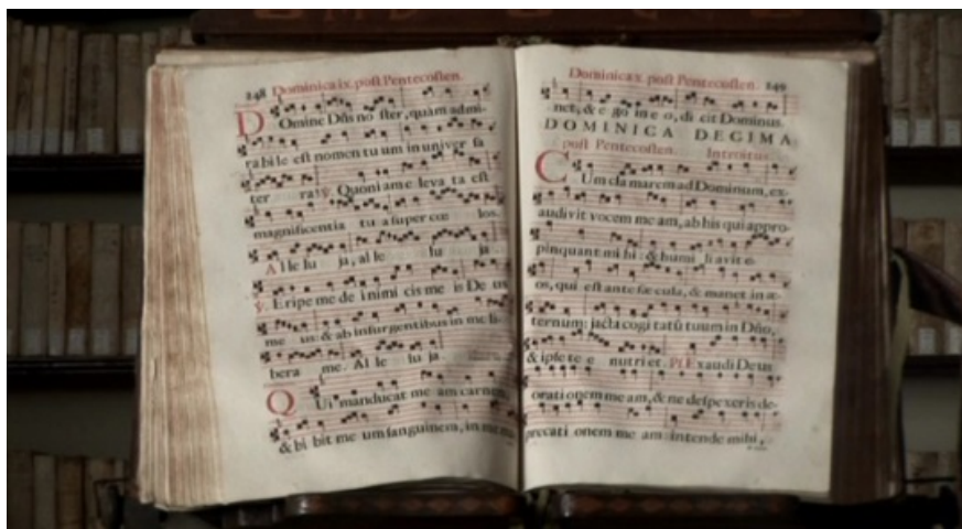
Fig. 3 - Manuscript of the Camaldolese monastery library at Fonte Avellana ( http://www.fonteavellana.it/home.php?lingua=italiano&menu=BIBLIOTECA&sottomenu=Biblioteca%20storica&img=2 ).