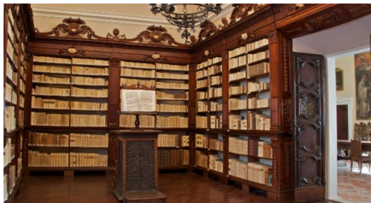
Fig. 1 - Camaldolese monastery library at Santa Croce di Fonte Avellana ( http://www.fonteavellana.it/home.php?lingua=italiano&menu=BIBLIOTECA&sottomenu=Biblioteca%20storica&img=1 ).

In the middle ages, each monastery had its own library, with a scriptorium , an area where the sacred writings and the ecclesiastical books were copied by hand (from where the term “amanuensis” comes from). Although the archaeological digs have not yet confirmed it, it can be hypothesised that the San Nicola monastery also had a library, as the Camaldolese order attributed great importance to intellectual life. It would be plausible to imagine the existence of a scriptorium , as the Benedictine monks, spiritual fathers of the Camaldolese order, were masters of copying (figs. 1-3). The amanuensis school at the Camaldolese hermitage (headquarters of the order) was one of the most prestigious in Europe.