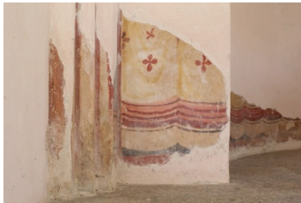
Fig. 1 - The faux velarium in the lower part of the apse (photo by Unicity S.p.A.).

The velarium decoration represented a painted awning, often imitating the real fabrics of the period, with a decorative function (they are also present in Saccargia, SS. Trinità and in San Giovanni di Sinis in Sardinia). Sometimes, this part of the decoration could show allegorical figures or non-sacred “genre” and was the only space permitted for non-sacred representations in a church (for example: Santa Maria Immacolata in Ceri, Lazio).