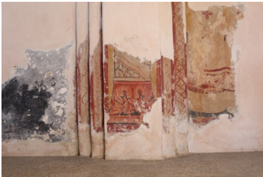
Fig. 4 - The faux velarium in the northern wall.