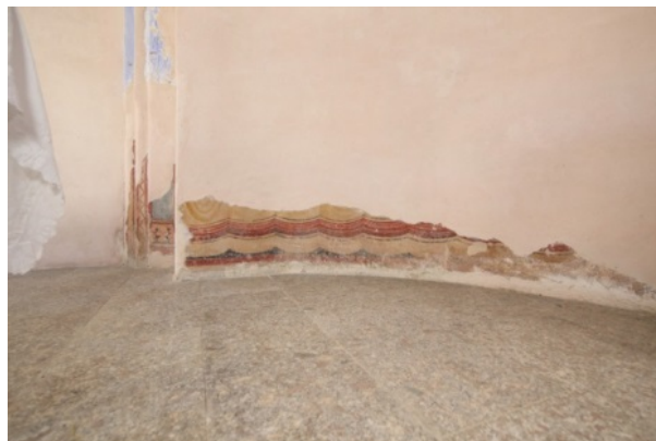
Fig. 2 - The faux velarium in the lower part of the apse.