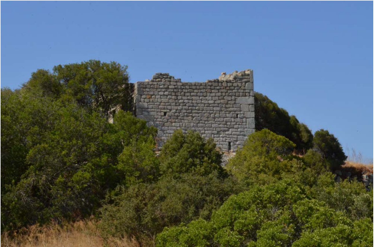
Fig. 3 - Luogosanto, Castle of Balaiana: view from the North.