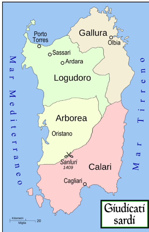
Fig. 1 - Map of the Sardinian Giudicati (from https://upload.wikimedia.org/wikipedia/commons/thumb/c/c5/Giudicati_sardi_1.svg/2000px-Giudicati_sardi_1.svg.png ).

During the Middle Ages the territory of Luogosanto was part of the Giudicato of Gallura and is mentioned for the first time in a letter sent to the Giudici of Torres, Arborea, Cagliari and Gallura (Fig. 1), by Gregory VII on 14th October 1073.