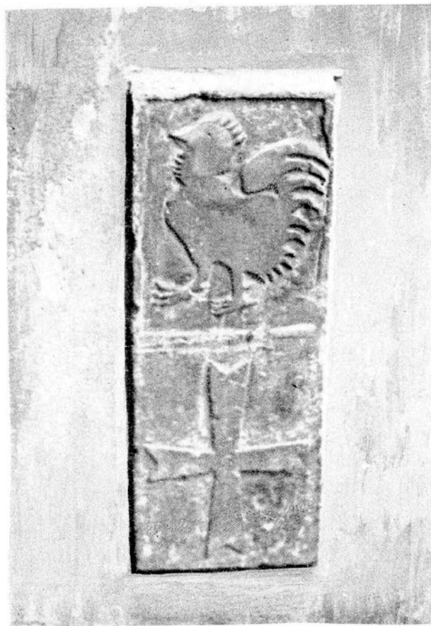
Fig. 3 - Coat of arms of the Giudicato of Gallura found in Pisa (from https://it.wikipedia.org/wiki/Giudicato_di_Gallura#/media/File:Stemma_giudicato_gallura_-_2013.jpg ).

to the socio-economic changes and traumatic events, such as the plague, wars and ransacking. The end of the giudicato's autonomy coincided with the years 1288-1298, the culmination of a process of relations with Pisa - initially favoured by the Holy See - that lasted for more than a century, and that meant direct government by the Tuscan town. marriages sealed close relations between Sardinia and the town: the first of which was between Elena di Gallura and Lamberto Visconti (1206-1207), starting up a series of Pisa giudici in Gallura.