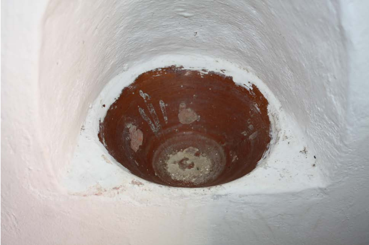
Fig. 4 - Luogosanto, Church Santo Stefano: monochrome enamel pottery holy water bowl.

Near the side entrance there is a monochrome enamelled pottery holy water bowl (fig. 4) but it may have been a replacement for another one found in the layers of abandoned items in the nearby brick kiln: the pieces of the Ligurian bowl from the end of the 19th century are similar to the one used at San Smplicio di Lu Macchietu.