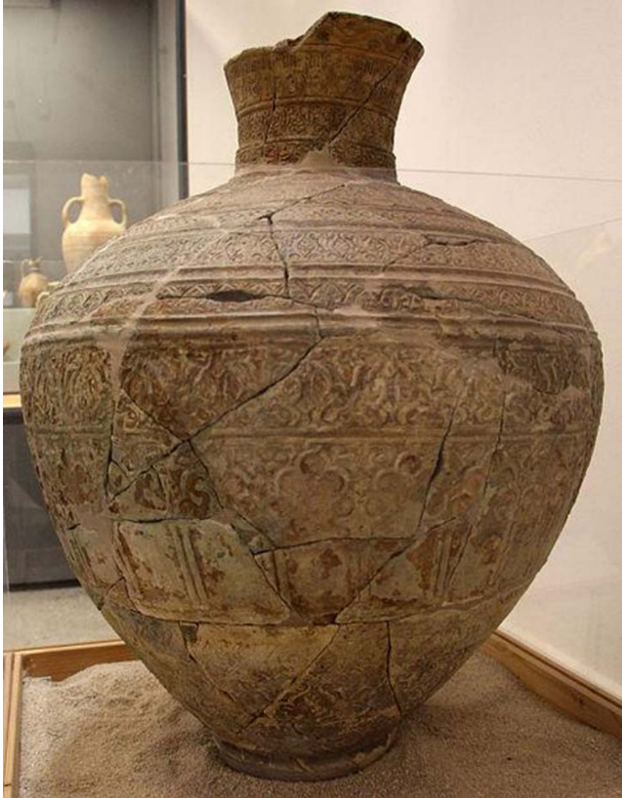
Fig. 5 - Sassari, Museum G.A. Sanna: Islamic jar from Alghero, Cala Galera.

In Sardinia, similar items are extremely rare: an item found during the underwater dig of the wreck of Cala dell'Olandese was recomposed almost entirely (fig. 5) and can be compared with similar in Sicily, with the urn found at La Cala, the ancient port of Panormo (Palermo).