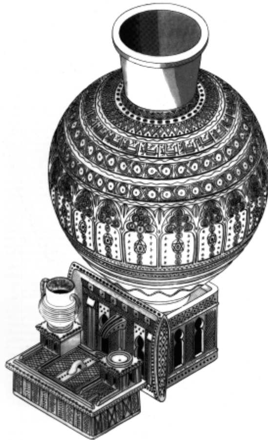
Fig. 4 - Ceramic kit for ablutions (Navarro, Jimenez 2009, p. 697).

These items were produced in Andalusia and Maghreb, between the 12th and 14th century and in such regions used to contain water for ritual ablutions: the decorations have apotropaic and purifying value (fig. 4).