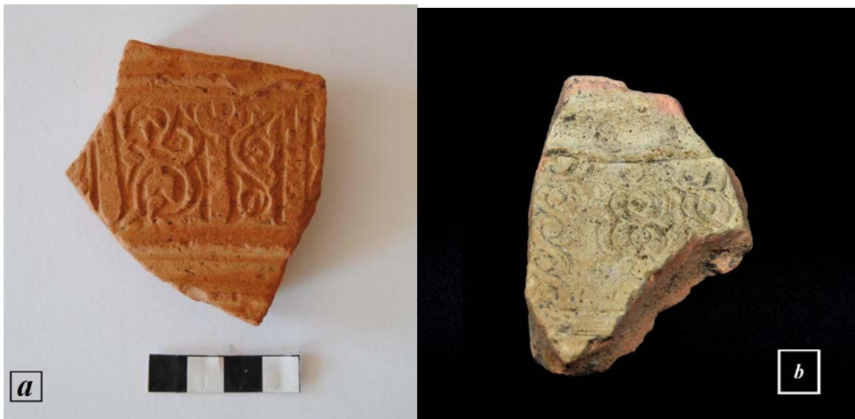
Fig. 1 - Luogosanto, Palace of Baldu: fragments of Islamic jars with stamped engraved decoration (a. photo by F. Pinna; b. photo by Unicity S.p.A.).

They are various fragments of food containers - some of which refer to an urn were found in a well of room iota - characterized by decorations pressed into the unfired clay with floral, geometric or pseudo-epigraphic patterns arranged in overlapping registers. The external surface is faded on the surface without a coating in some items (fig. 1) while in others covered by a light blue glass (figs 2-3).