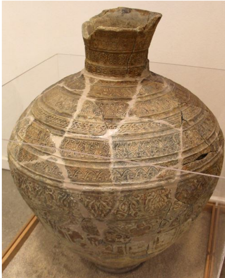
Fig. 2 - Islamic jar recovered from the wreck of Capo Galera, Alghero, SS.

These containers came from North Africa and Spain and they were widespread between the eleventh and thirteenth centuries not only in Muslim Sicily, but also along the southern coasts of France and of Tyrrhenian Italy (Liguria, Tuscany, Lazio).