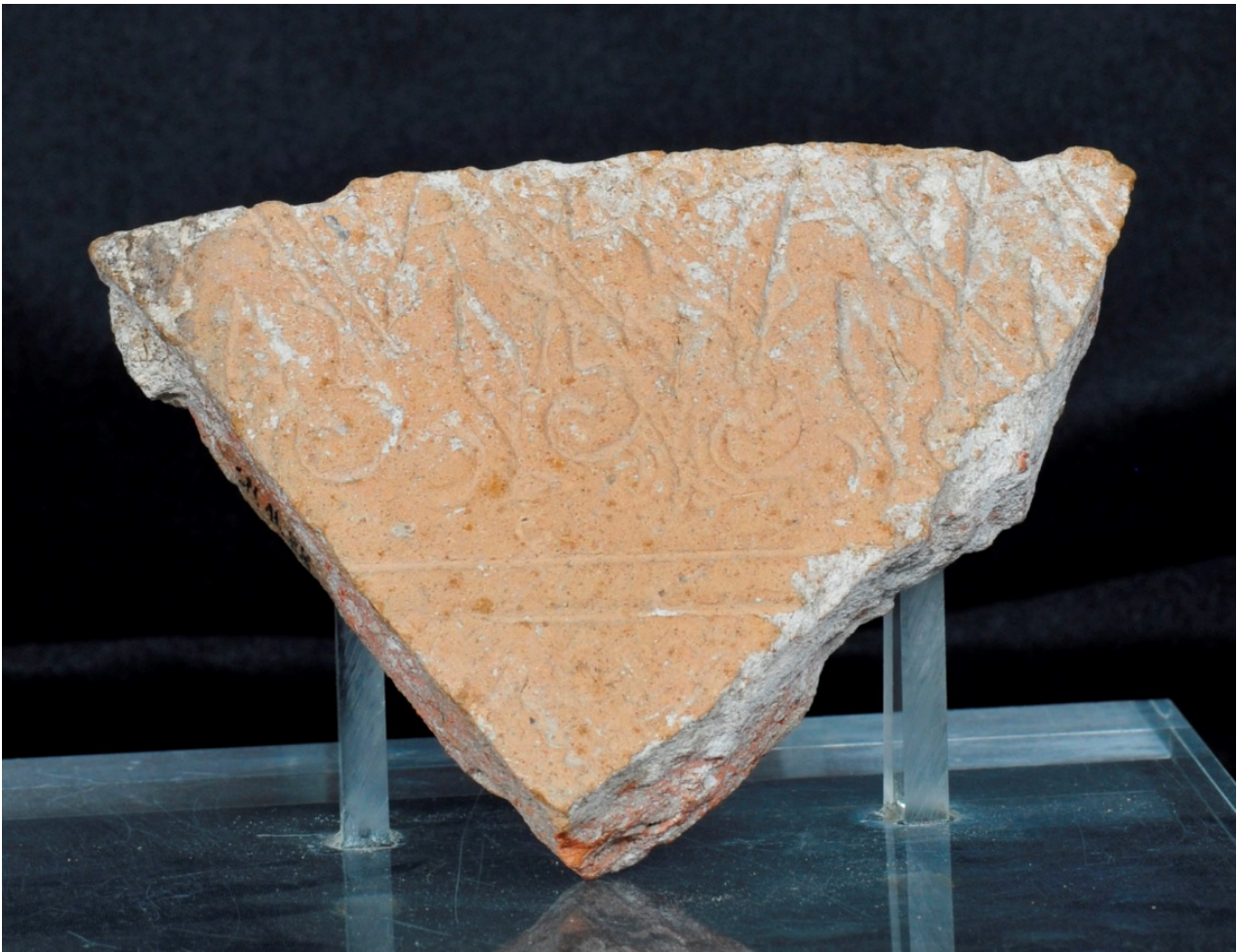
Fig. 1 – Fragment of Islamic jar from the castle of Monreale.

The piece is engraved with a pseudo-epigraphic decoration in horizontal bands on its outer surface (fig. 1).