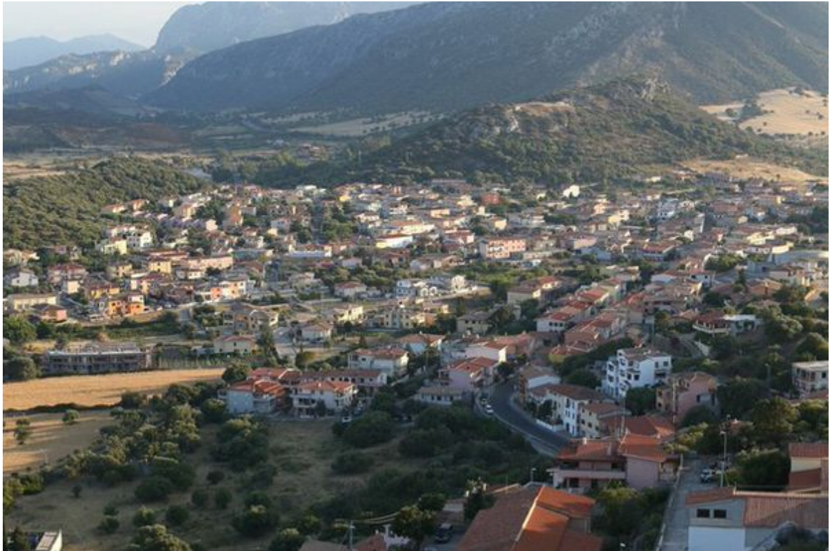
Fig. 2 - Modern development of the town of Posada; in the background on the left, Monte Furcas, on the right Monte Idda.