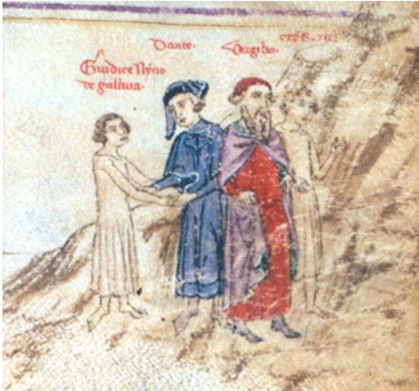
Fig. 3 - Dante meets Nino Visconti.