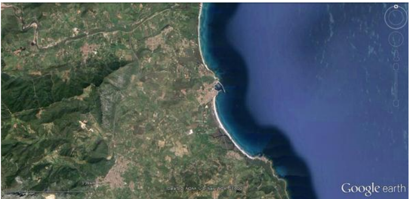
Fig. 2 - Probable route and landing place of Federico Visconti (reconstruction by E. Dirminti).